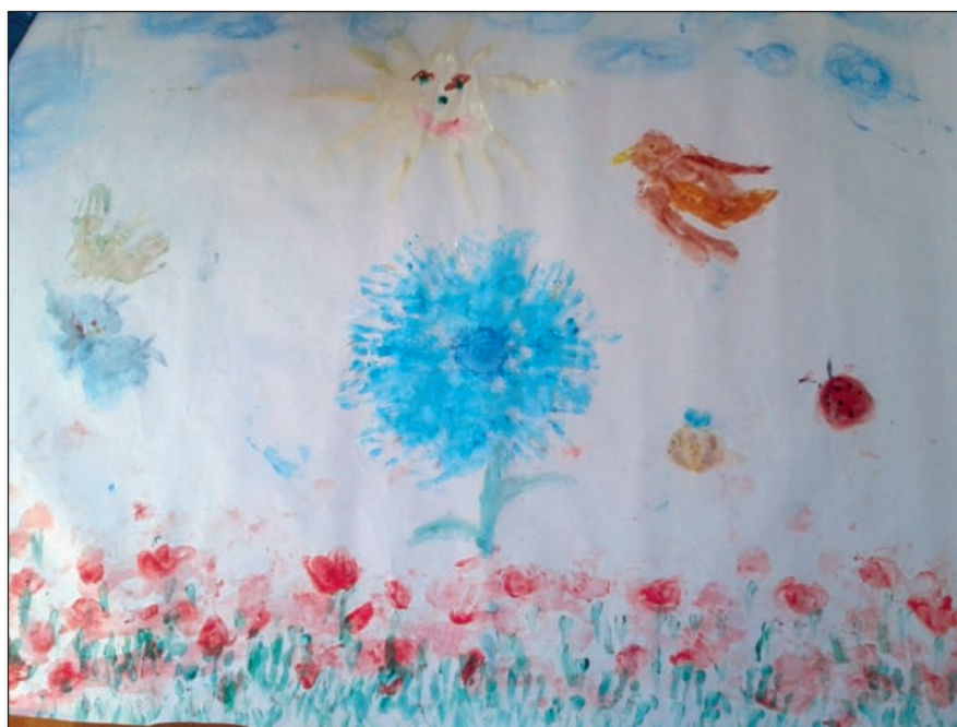
Disegno di Lele

Un giorno, in quel terreno, arrivò un fotografo: una famosa rivista di moda lo aveva incaricato di immortalare il più bel campo di papaveri che si fosse mai visto prima d'ora. Scese dall'auto ed iniziò subito a fare delle foto; non aveva tempo da perdere, doveva tornare al più presto al giornale con un'immagine da prima pagina! Scattate alcune foto, alzò gli occhi alla ricerca di una nuova prospettiva e vide Lulù, che sveltava maestoso in mezzo a tante macchioline